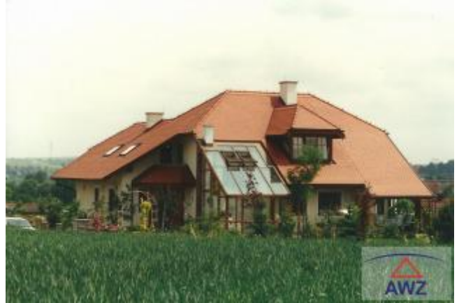
Terrasse mit Pool