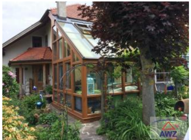
Terrasse zum Pool